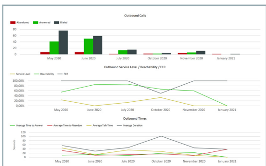
Skill Overview Reporting-Tool